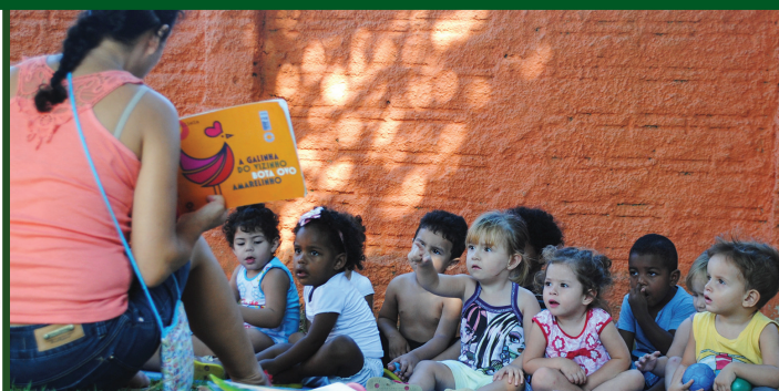
Os locais de realização da prova serão divulgados no endereço eletrônico do processo seletivo até o dia 15 de outubro

Em 27 áreas, foram abertas inscrições para processo seletivo para os cargos de professor, professor auxiliar, administrador escolar, orientador educacional, supervisor escolar e auxiliar de sala. As inscrições, pela internet, irão até as 16 horas do dia 20/08: http://substituto2019.fepese.org.br/ . A seleção é para a formação de cadastro reserva para vagas que surgirem em 2019.