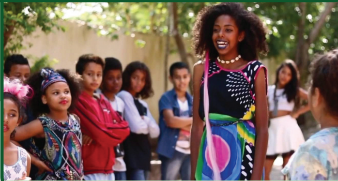
"A flor da pele" mostra o processo de empoderamento de crianças negras