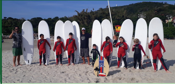
Objetivo do projeto é despertar o interesse pelas questões ambientais