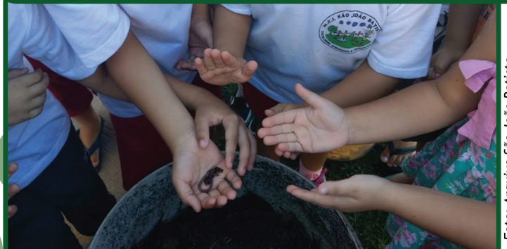
Crianças aprendem atividades simples e sustentáveis