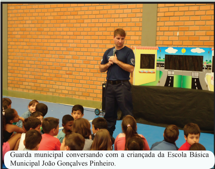
Guarda municipal conversando com a criançada da Escola Básica Municipal João Gonçalves Pinheiro.

O projeto Trânsito 24 horas na Escola está em andamento em estabelecimentos de ensino da rede municipal de Florianópolis. A proposta é conscientizar alunos e professores quanto a educação no trânsito, comportamento, leis, direitos e deveres de pedestres e motoristas.