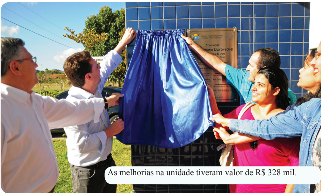
As melhorias na unidade tiveram valor de R$ 328 mil.