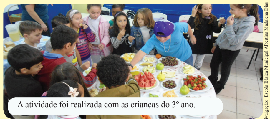
A atividade foi realizada com as crianças do 3º ano.

O objetivo inicial era abordar o gênero textual “receita”, já que o livro é ilustrado com vários pratos da culinária tropical. No debate da obra surgiu a ideia de trabalhar com os alunos a alimentação de qualidade, através da degustação de frutas, sanduíches e sucos naturais.