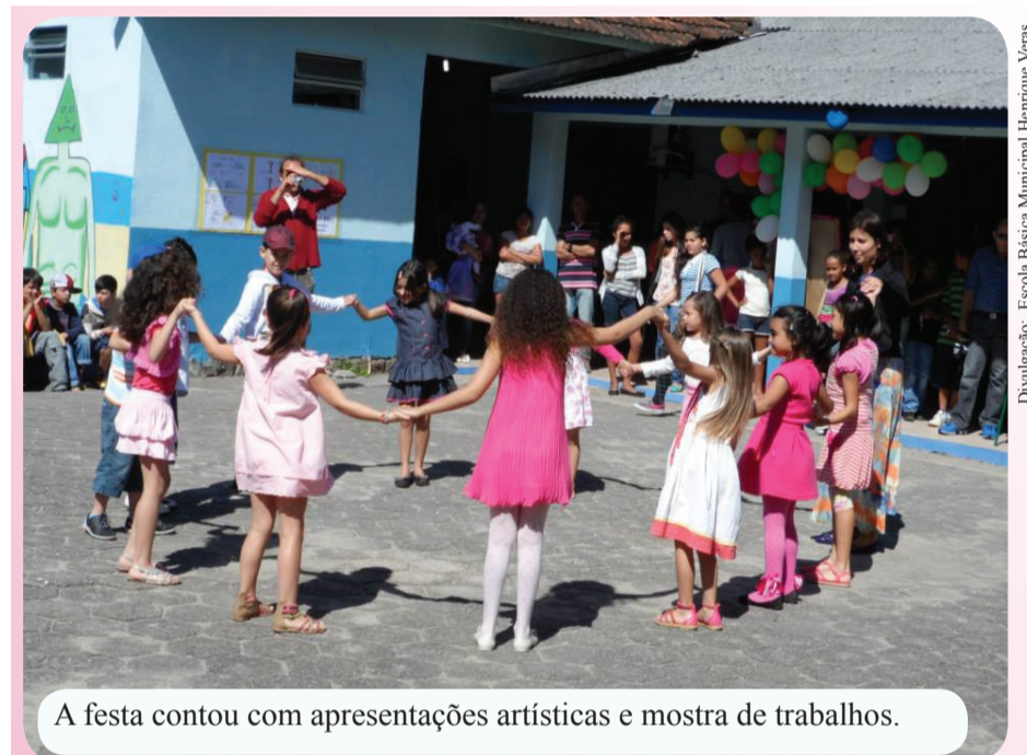
A festa contou com apresentações artísticas e mostra de trabalhos.