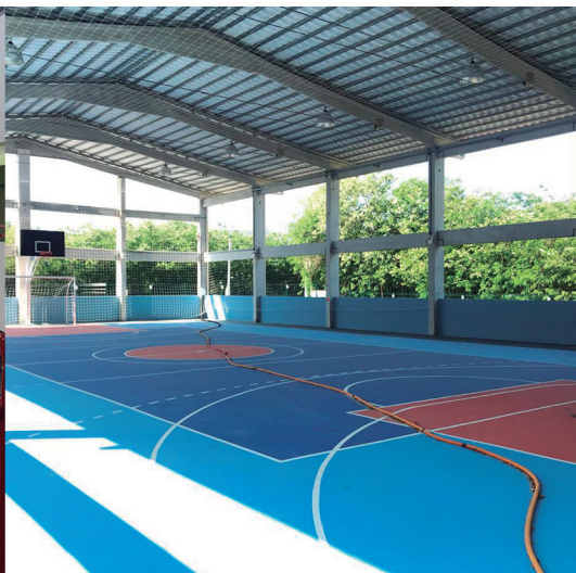
Escola do Futuro | EBM Mâncio Costa