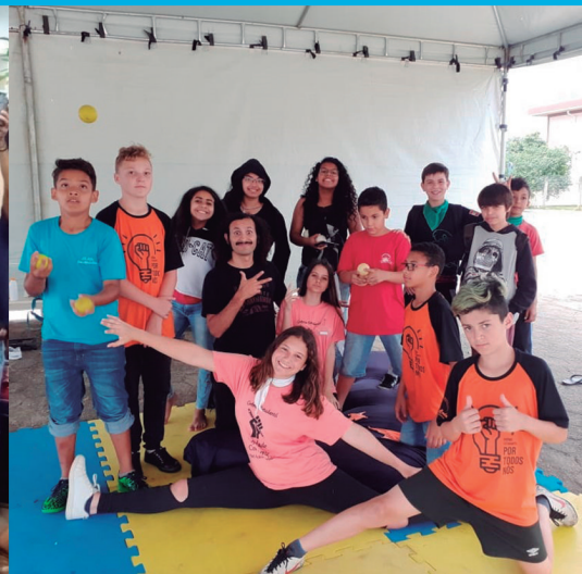
Oficinas Integradas para o encontro de grêmios estudantis