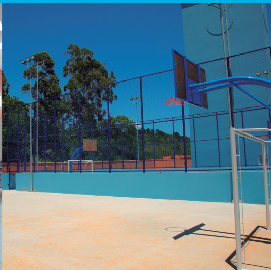
Escola do Futuro | EBM Tapera