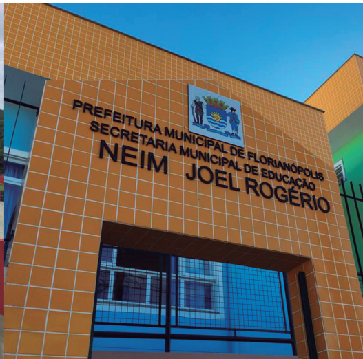
Neim Joel Rogério de Freitas | Monte Cristo

O Núcleo de Educação Infantil Municipal Joel Rogério de Freitas passou por uma reforma e ampliação do espaço do estabelecimento de ensino.