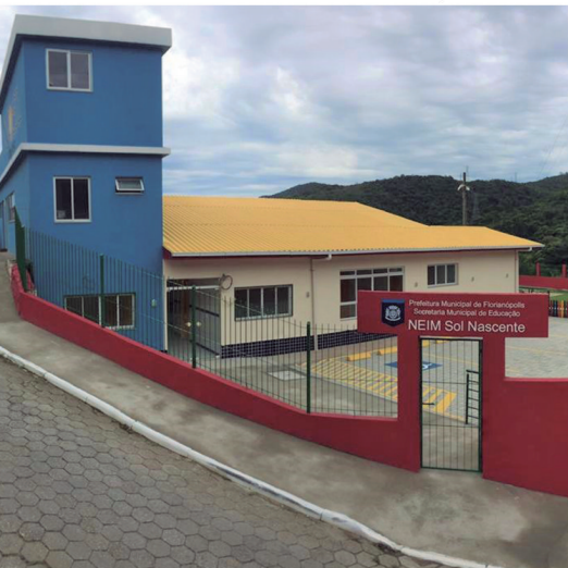
Neim Sol Nascente | Saco Grande