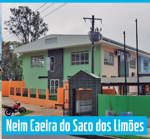
Neim Caeira do Saco dos Limões

Previsão de conclusão: 1º semestre de 2020 Investimento: R$ 3.777.431,91 Vagas: 150 a 200