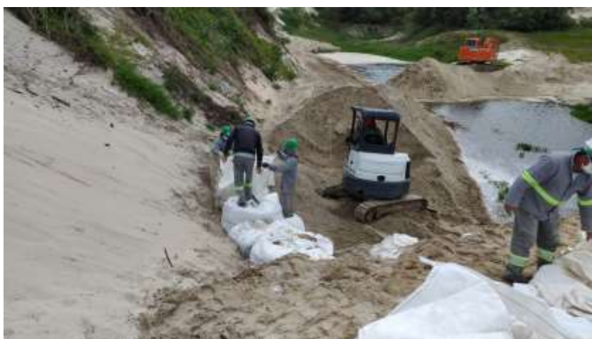
Figura 1: assentamento das geofomas em 16/06/2021.