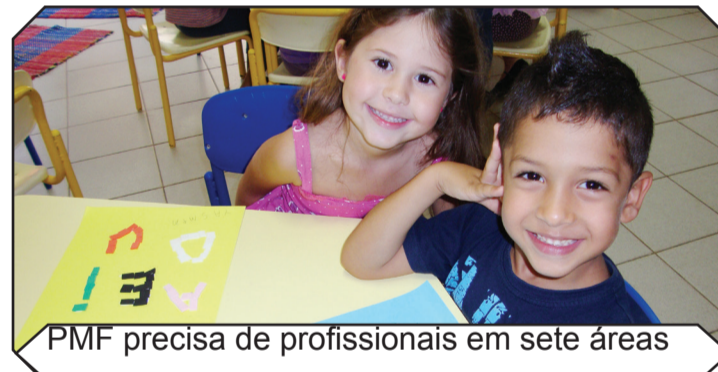
PMF precisa de profissionais em sete áreas

A Prefeitura de Florianópolis está com inscrições abertas para cadastro reserva de professores. Há necessidade de profissionais em sete áreas. O cadastro é para professores de Artes Cênicas, Auxiliar de Educação Especial, Artes Música, Artes Plásticas ou Visuais, Inglês, Auxiliar de Língua Brasileira de Sinais e Matemática. Os interessados devem se dirigir, das 13h às 19h, até a Gerência de Articulação de Pessoal da Secretaria Municipal de Educação. Rua Conselheiro Mafra, 656,4º andar, sala 402.