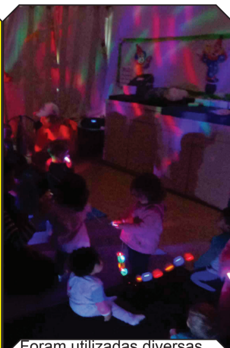
Foram utilizadas diversas luzes e refletores giratórios

A proposta envolveu vários estímulos visuais e expansão dos movimentos, com o objetivo de despertar a curiosidade e a sensibilidade dos pequenos que possuem entre seis meses a dois anos.