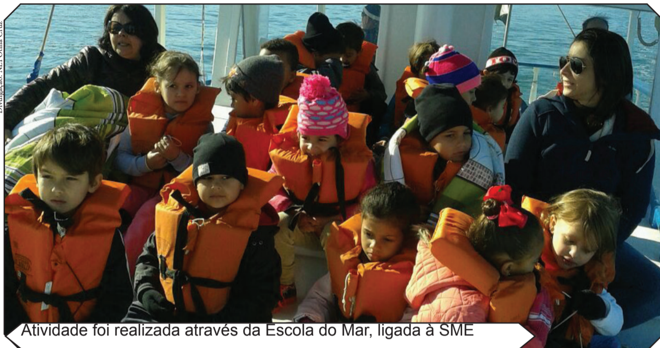
Atividade foi realizada através da Escola do Mar, ligada à SME