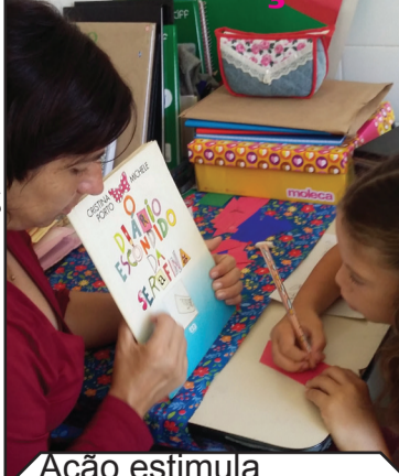
Ação estimula criançada a participar

Na sala multimeios do NEI Raul Francisco Lisboa estão sendo realizadas atividades baseadas no livro “O diário escondido de Serafina”, de Cristina Porto. Trabalhando elementos da história, os exercícios buscam estimular a criançada a aperfeiçoar suas capacidades, a sair de suas zonas de conforto e a aprender com as diferentes habilidades dos colegas. Além de propostas envolvendo escrita, desenho, pintura e colagens, foi confeccionado um livro interativo com brincadeiras, como de amarrar um barbante feito cadaço de tênis e jogo da velha.