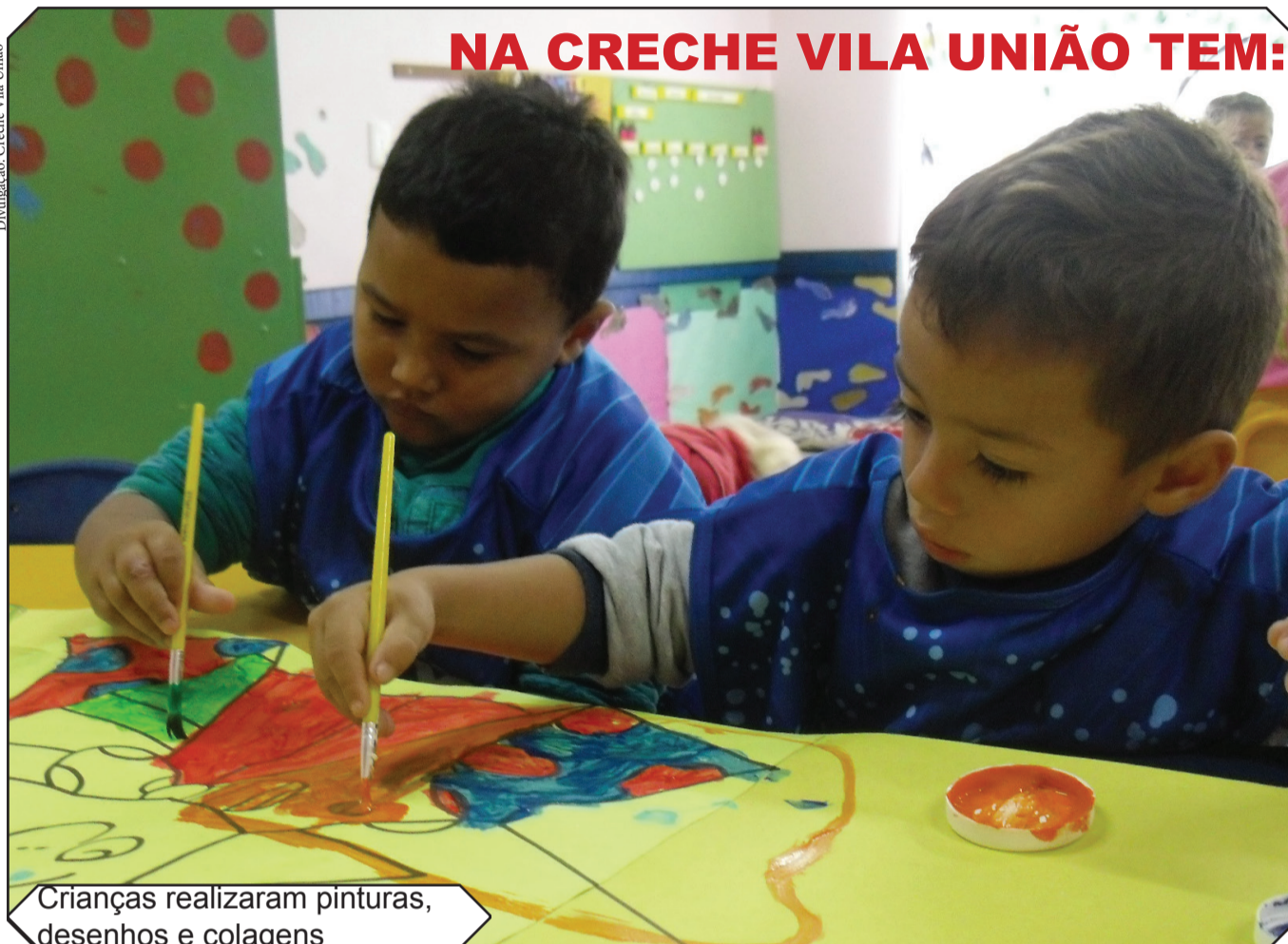
Crianças realizaram pinturas, desenhos e colagens