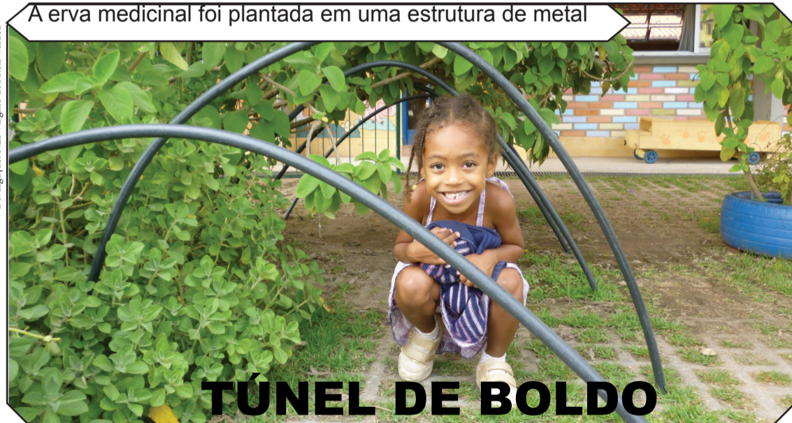
A erva medicinal foi plantada em uma estrutura de metal