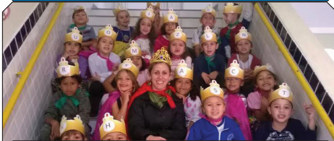
Projeto utiliza a encenação de histórias como forma de aprendizado