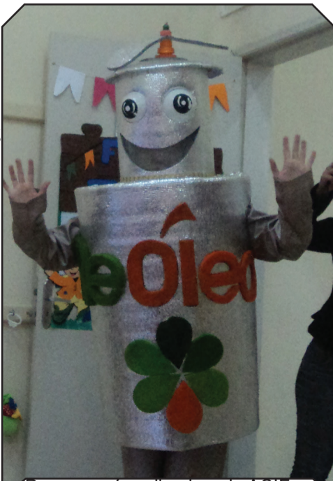
Programa é realizado pela ACIF