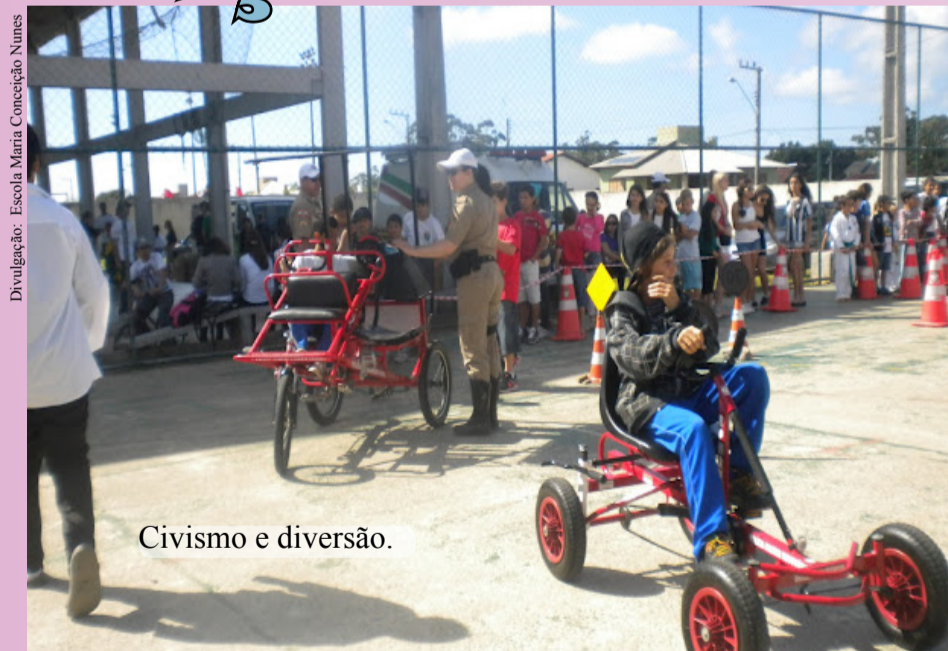
Civismo e diversão.

Pais e estudantes participaram de um desfile cívico nos arredores da Escola Básica Maria Conceição Nunes, no Bairro Rio Vermelho (15/09). A iniciativa fez parte da Ação Cidadã, projeto desenvolvido pela instituição em parceria com a Escola Básica Antônio Paschoal Apóstolo e a Igreja Batista. Foram disponibilizados também para a comunidade educativa e aos demais moradores da região serviços de lazer, saúde e cidadania. O projeto ocorre há dois anos.