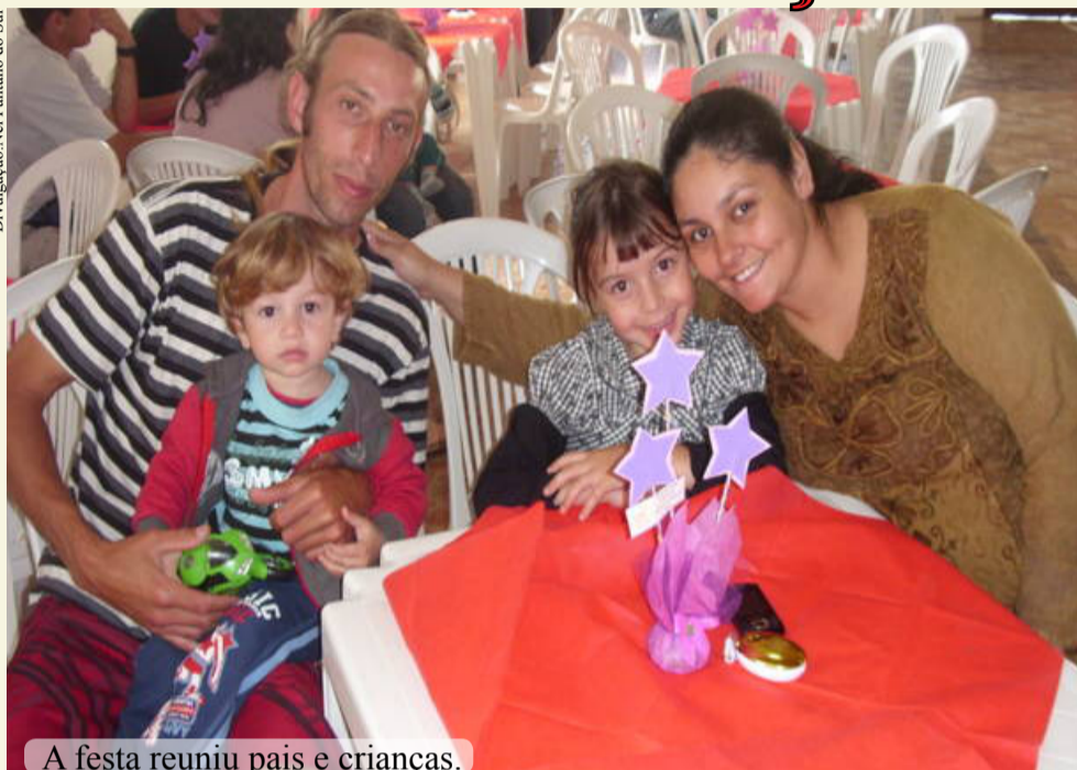
A festa reuniu pais e crianças.

Oficina de fuxico, pintura facial, contação de história, exposição de trabalhos dos pequenos, além de apresentações artísticas, como Boi de Mamão e roda de capoeira. Essas atrações marcaram a segunda edição da Festa da Família organizada pelo NEI Pântano do Sul (15/9). Houve ainda um almoço coletivo reunindo a criançada, pais, mães, professores e demais funcionários da instituição.