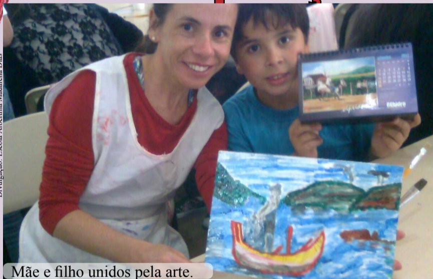
Mãe e filho unidos pela arte.