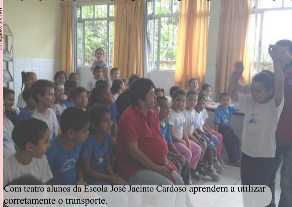
Com teatro alunos da Escola José Jacinto Cardoso aprendem a utilizar corretamente o transporte.

O projeto Educando no Ônibus foi criado especialmente para a semana do Dia Mundial sem Carros. Promovido pela Secretaria Municipal de Transportes contemplou quatro escolas da rede municipal de ensino: Antônio Paschoal Apóstolo, Albertina Madalena Dias, Mâncio Costa e Escola Desdobrada José Jacinto Cardoso.