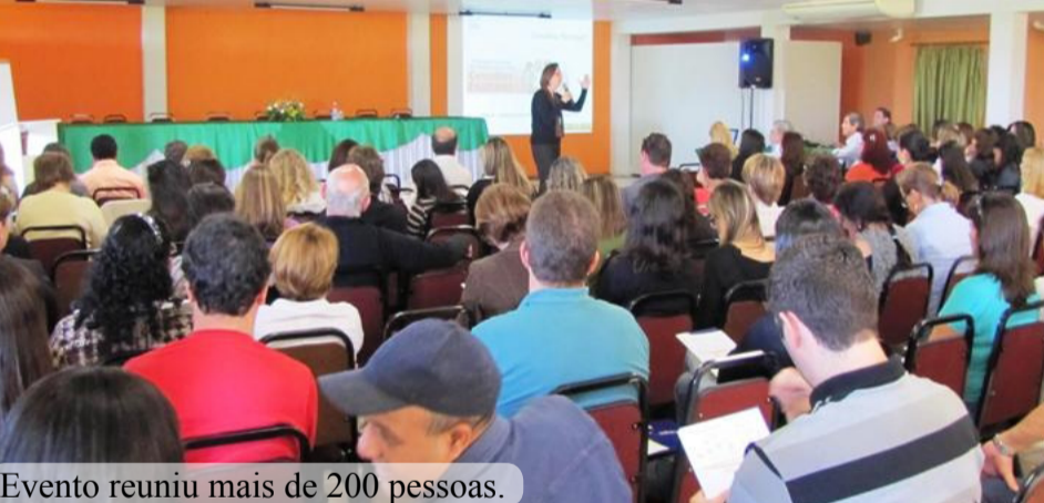
Evento reuniu mais de 200 pessoas.

Pais e comunidade mais perto da escola, acompanhando o ensino e a administração da unidade. Essa é uma característica dos Conselhos Escolares, implantados ou que estão sendo criados na rede municipal de ensino de Florianópolis. Para discutir o assunto, foi organizado um encontro com educadores, pais, alunos e demais funcionários das diversas instituições ligadas à prefeitura (22/09). Com mais de 200 participantes, no encontro ocorreu a formação para membros de escolas, creches e núcleos de educação infantil que não possuem ainda conselhos e a avaliação das unidades que já adotaram a ideia. Além disso, houve o lançamento de uma cartilha que, entre outros itens, explica o que é conselho escolar, qual o papel dele e suas atribuições.